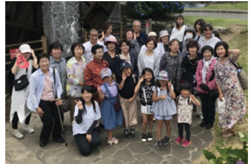
熊本復興支援活動では今回、ミニバスツアーを実施した。

「初参拝 10 人」を心定めに実動した第 5 次隊。目標達成はならなかったものの、8 人が初参拝。その中には、4 年越しに初参拝が叶った家族も。