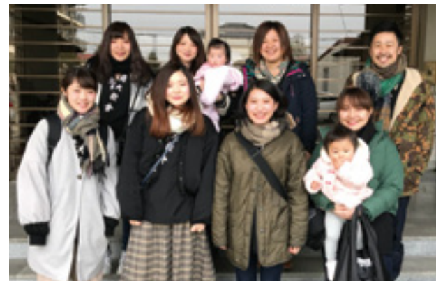
いよいよ終盤を迎える「後継者講習会」。参加者らは、「陽気ぐらしの種」を手にし、実践を誓った。