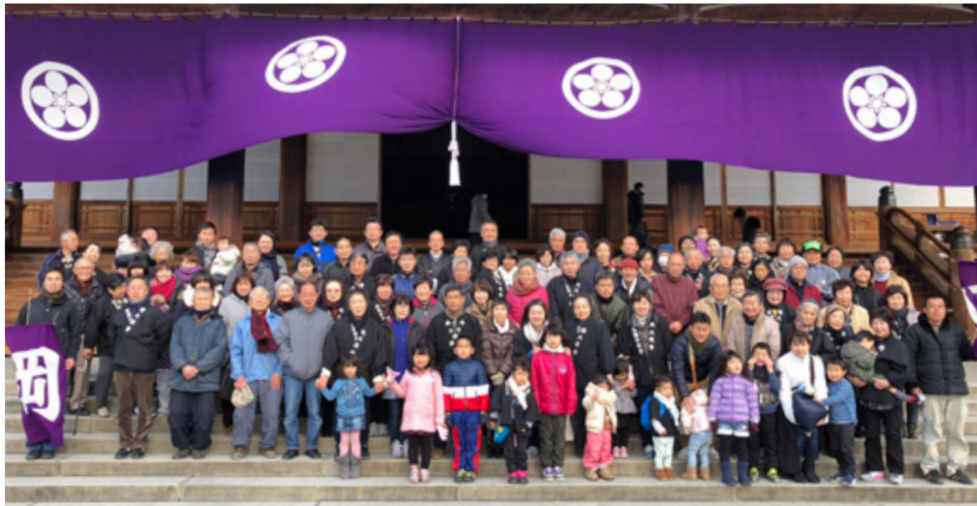
1月恒例の「おぢば伏せ込みひのきしん」。今年は約120名が参加し、東西礼拝場階下の清掃ひのきしんに当たった。