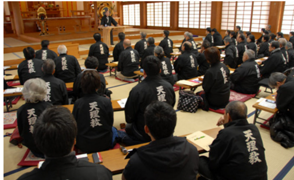
方針を共有し、一手一つの実動を誓い合う「年頭会議」には、教会長夫妻ら72名が参加した。