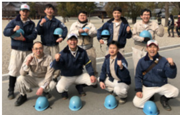
寒さ厳しい2月に「ひのきしん隊」と「3日隊」に入隊した青年会員9名。共に、おぢばに伏せ込んだ。