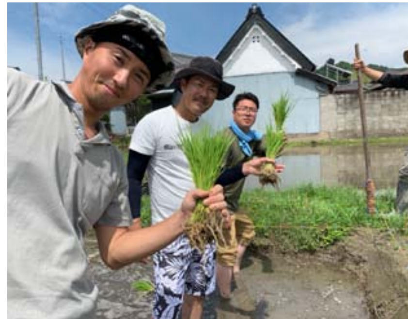
青年会岡分会は、青年会本部の「特別ひのきしん隊」に5名が参加。