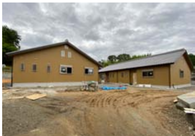
足場が撤去され、全容が明らかになった教職舎。