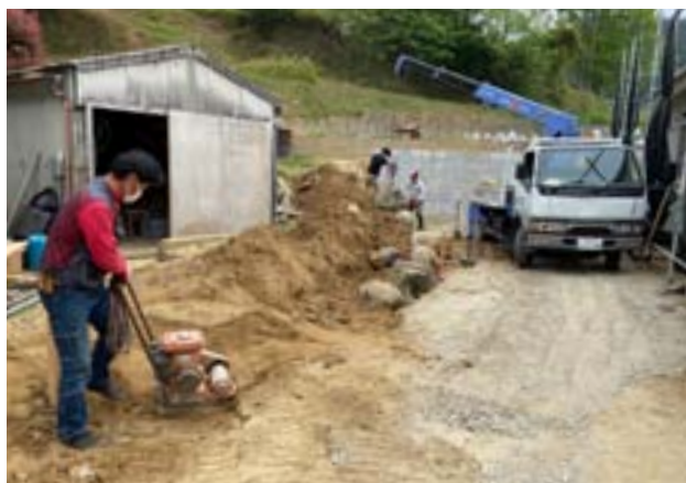
外構作業では、ブロック塀や排水路の設置、石積みなどをすべてひのきしんの手で実施。三密、と熱中症に気を付けながら、慣れない作業を進める。