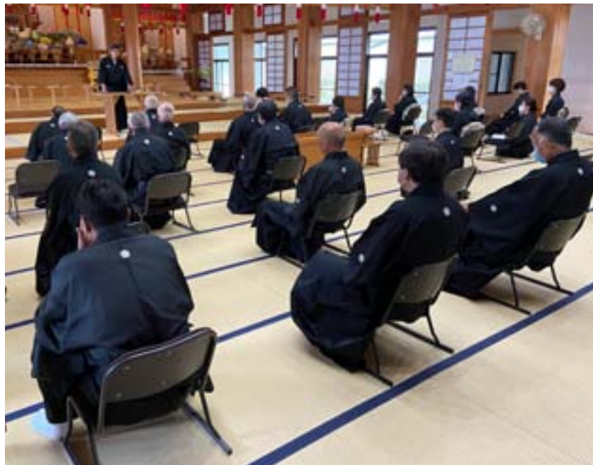
4月、5月は対象者を限定し、距離を確保してマスクを着用した上で月次祭を執行。昼食には、お弁当が配られた。