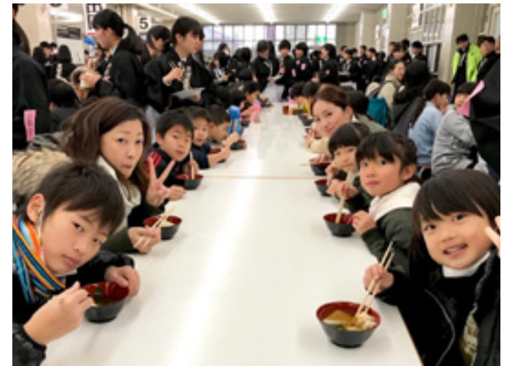
年末恒例の、ご本部へお供えさせていただくお餅つき（写真左＝12月27日、大教会厨房で）。お下がりのお餅を頂く「お節会」には、寒さをいとわず各教会から団参が組まれた。（写真右＝1月6日、本部第1食堂で）